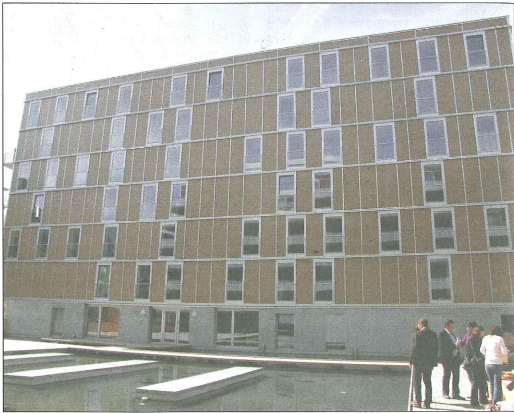
La façade solaire Lucido permet une économie de chauffage de 70% à 80%. En-dessous, on aperçoit les bassins de récupération d'eau pluviale.